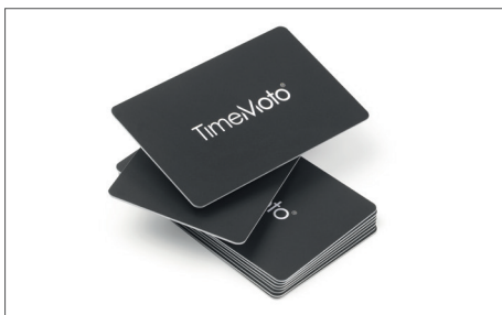
Juego de 25 tarjetas RFID TimeMoto RF-100 Nº de artículo: 125-0603