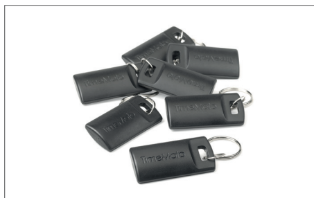
Juego de 25 llaveros RFID TimeMoto RF-110 Nº de artículo: 125-0604