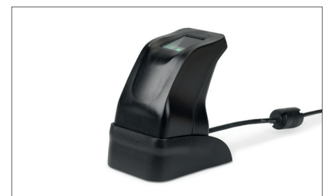
Lector de huellas dactilares USB TimeMoto FP-150 Nº de artículo: 125-0606