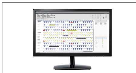
Software TimeMoto para PC incluido