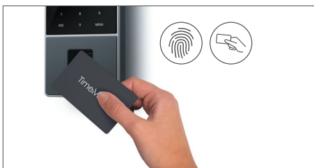
Se puede fichar con tarjeta de proximidad RFID, con huella dactilar o con código PIN

* Tras el periodo de prueba de 30 días, seleccione su suscripción: TimeMoto Cloud o TimeMoto Cloud Plus