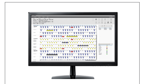
Software para PC TimeMoto Plus Nº de artículo: 139-0600