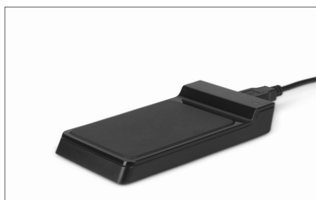
Lector RFID USB TimeMoto RF-150 Nº de artículo: 125-0605